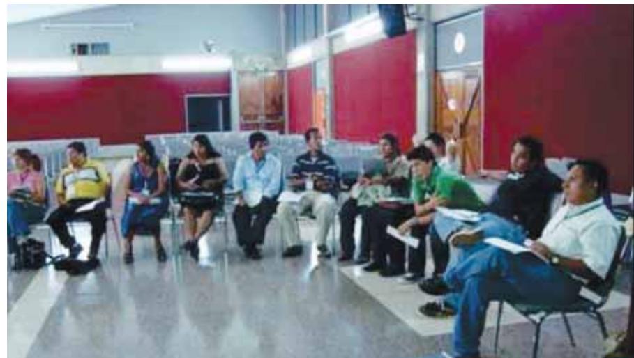
Estudiantes del Segundo Curso Internacional para Líderes Indígenas de Centro América sobre Gobernabilidad y Políticas Públicas desde la Cosmovisión Indígena.

La formación que los 18 líderes indígenas de Guatemala, Honduras, El Salvador, Costa Rica Nicaragua y Panamá reciben con este curso deja constancia del impacto de la misma, en la mediación y gestión técnica de temas que son de interés de los Pueblos Indígenas como los derechos colectivos e individuales de los Pueblos Indígenas, especialmente el derecho a sus tierras y territorios, bienes, empleo, salud, educación y a determinar libremente su condición política y su desarrollo económico. ■