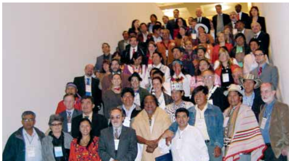
Foto de grupo de los asistentes a la VIII Asamblea General del Fondo Indígena realizada en noviembre del 2008 en la ciudad de México.

Con el desarrollo de estos programas se busca hacer del Fondo Indígena un organismo internacional de derecho público consolidado, descentralizado, sostenible técnica, financiera e institucionalmente, a fin de promover el fortalecimiento y desarrollo político, económico, cultural, espiritual y social de los pueblos, comunidades y organizaciones indígenas de